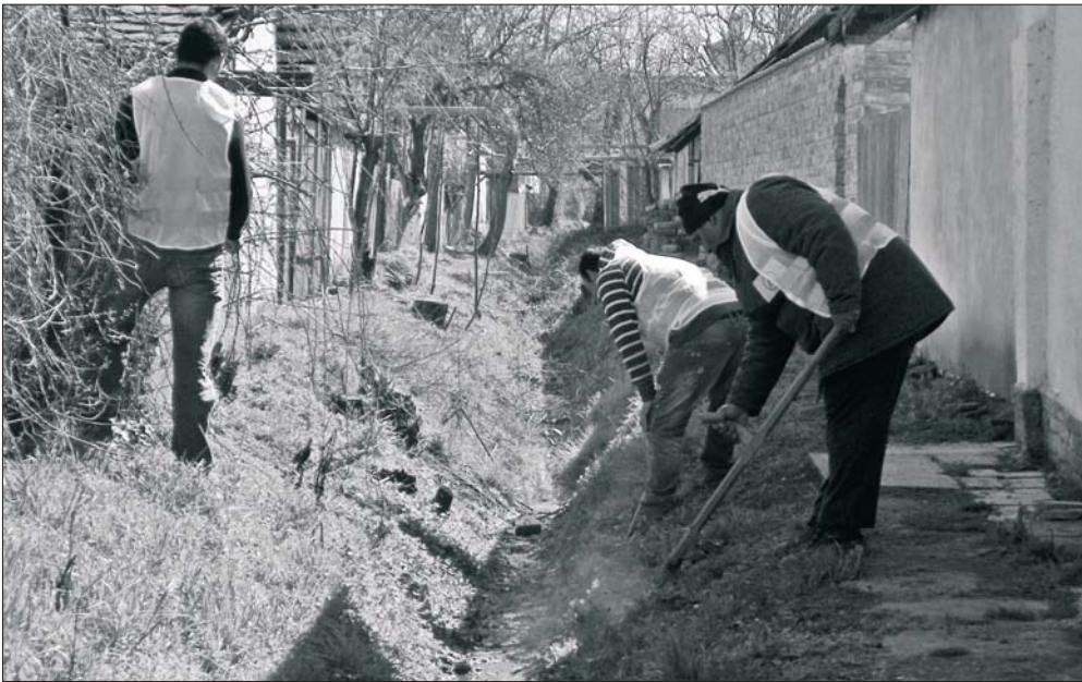
A mirhókat takarító közmunkások igazolni tudják magukat pecséttel ellátott igazolvánnyal.

Kéreg – Gógány, valamint az Árpád – Nagyörvény – Sáfrán M. utcákban folyik a mirhók és a csapadékvíz elvezető árkok takarítása, összesen 79 fővel. A 11,5 hónapon át tartó, összesen 104,5 millió forintos költségvetésű programra 78 százalékos támogatást kapott a város.