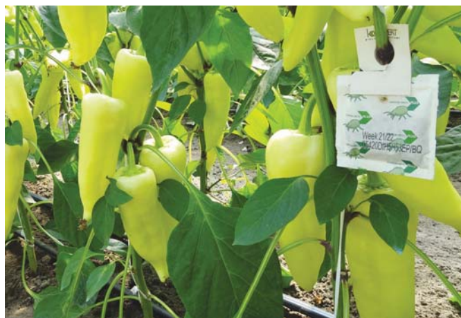
Tenyészotaszakos Swirski ragadozó atka telepítése.