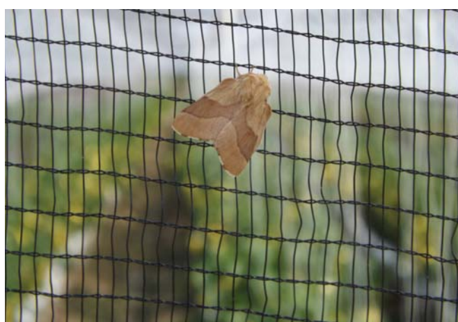
Működik a jéggháló, és a szellőzést sem fogja le.

varok telepítésére, mert a kártevők valószínűleg hamarabb támadnak, mint a korábbi években. Mindenképpen figyelni kell a palántanevelés utolsó időszakára, nehogy belekerüljön valamilyen veszélyes készítmény a technológiába, mert az elhúzhatja a telepítés időpontját, és az