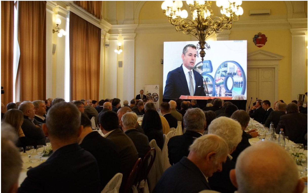
(a képen Dr.Gyuricza Csaba, a NAIK főigazgatója látható)

színesítette, és ahogyan az előadókat is, mindezt vastapssal méltatták a résztvevők. Az előadók mellett, hozzászólások is hangot kaptak.