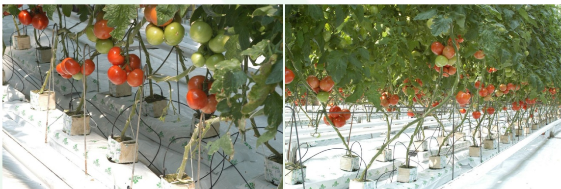
Az Árpád-Agrár Zrt. termálfűtésű üvegházai

A kiemelkedő helyi adottságok miatt a cégcsoport a termálvízre alapozott kertészet fejlesztését helyezte a középpontba. Jelenleg a vállalat ezer kisebb-nagyobb partnernek szállít mintegy húszmillió palántát évente, ebből öt-hat milliót külföldi kertészetek számára.