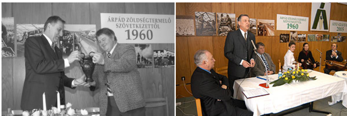
Az Árpád-Agrár Zrt. jubileumi ünnepe