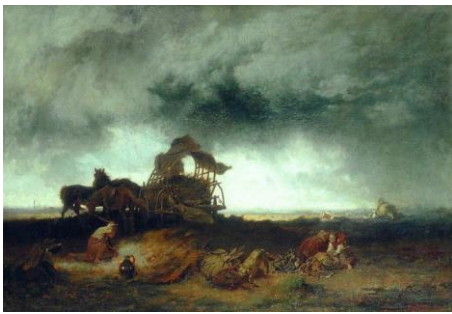
(Munkácsy M.: Vihar a pusztán)

És akárcsak Petőfit, úgy legelismertebb művészeinket is számtalanszor megihlette már az alföldi táj festőisége.