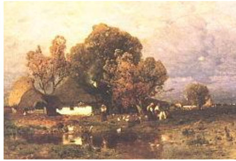
(Mészöly M.: Alföldi tanya)

Ám az ihlet nem csupán a művészek kiváltsága. Nap, mint nap ezreket szólít meg és „varácsol el” ez a táj, és ennek köszönhetően a föld szeretete végül mindig tovább öröklődik és méltó, gondos utódokra lel.