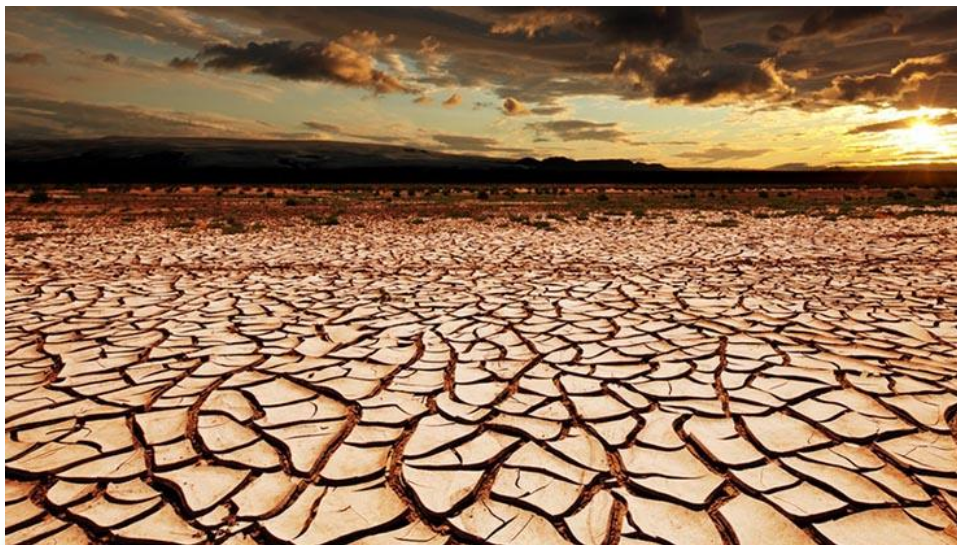
Aszály sújtotta terület - illusztráció

A nagy meleg valamennyi termesztett növényi kultúrára hatással van. A tartósan magas hőmérséklet hatására különösen akkor, ha az vízhiánnyal párosul, a kultúrnövények kevesebb szerves anyag előállítására képesek, vagyis termésveszteség következik be. Sőt, a hőségben a kártevők is elszaporodnak, amely csak hatványozza az aszály okozta károk egyébként is jelentős mértékét.