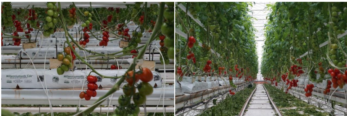
Az Árpád-Agrár Zrt. üvegházának öntözőberendezése

Ez a hosszú távú befektetés nem feltétlenül a vízszámlák miatt fontos. Ilyen kezdeményezések, apró odafigyelések során remélhetőleg el fognak kezdődni egy világszintű összefogás felelős vízfogyasztása érdekében.